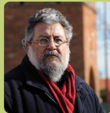
Par Abdelmadjid Kaouah