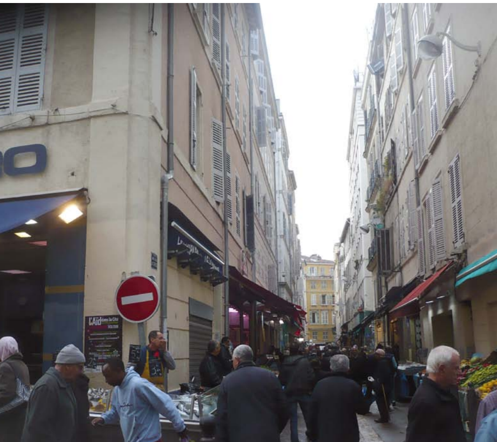
A Noailles, au cœur du 1 er arrondissement, presque tous les commerces sont tenus par des Maghrébins.

doute ce qui caractérisera de plus en plus le futur Maghreb à Marseille, et c'est tant mieux.